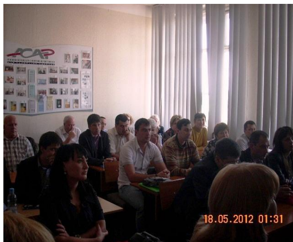
Pe foto: grupa SCFR la curs de instruire ȘContabilitatea corporativă și computerizat din IC: contabilitate.

La finele cursului de instruire, participanților SCFR s-au înmănat Certificatele ACAP de absolvire.